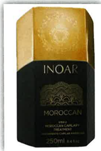
Presentación de Inoar Moroccan Step 2 Capillary Treatment