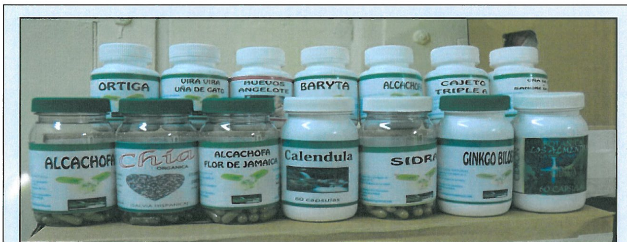
Fotografía de Algunos de los productos fabricados por Botánica Los Almendros para el Centro Naturista El Manantial de la Salud

El Centro Nacional de Farmacovigilancia ha recibido un reporte de sospechas de reacciones adversas en la que se describe: vómitos, desmayos, pérdida del equilibrio, alergias cutáneas y fuertes dolores estomacales. Estas reacciones adversas han sido posiblemente asociadas a productos que según sus etiquetados son 100% naturales ( Alcachofa, Maca, Colclean Fibra y Prostin ), fabricados y envasados por Botánica Los Almendros para el Centro Naturista El Manantial de la Salud. Cabe señalar que estos productos no cuentan con registro sanitario otorgado por el Ministerio de Salud; son elaborados con materias primas de procedencias no comprobadas, no se han comprobado los procesos de fabricación y envasado; y el lugar de fabricación o envasado (Botánica Los Almendros) no posee licencia de operación otorgada por la Dirección Nacional de Farmacia y Drogas, ni por el Departamento de Protección de Alimentos (DEPA) del Ministerio de Salud para fabricar este tipo de productos, ni ningún otro producto actualmente.